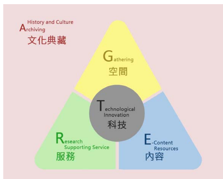
圖一 GREAT 三元素與五概念

圖書館擁有寬敞而明亮的多元活動空間，或有學生倚窗閱讀、小組交流辯論、老師發表研究發現、社團展現成果...等，這裡如同古希臘哲學廣場 Gathering 校內師生，在此進行多元而自由的跨學科思想對話、激盪與合作。紙本館藏透過密集自動倉儲系統、RFID 與機器人設置管理，移至實牆之後地板之下的空間。圖書館的核心係專業館員的 Research Supporting 服務，在師生研究的每個環節，都可得到對應的資源與建議，這背後有大量的 E-Content Resources 為後盾，結合個人化數據整合呈現，提供無圍牆服務。圖書館也持續 Archive 與紀錄新館設空間、研究服務與內容樣貌形塑的新校園歷史與文化，並善用 Technological Innovations 持續提升服務品質。這是個 Great 圖書館，屬於陽明交通大學的偉大圖書館。